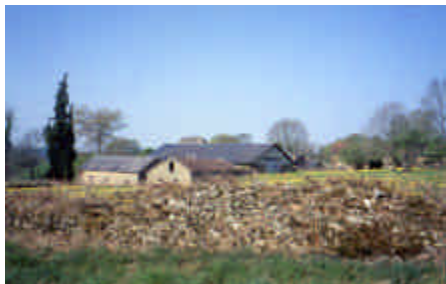
Amboiras, La Croisille-sur-Briance

Mille fois merci aux gens qui prennent la peine et le temps de confectionner une véritable claie.