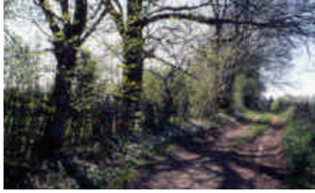
Le Puy de Venouhant, Châteauneuf-la-Forêt

Chemin de terre entre maisons et champs, longeant un enclos. Les arbres conservés dans la haie sont appelés « forêts de rives » par les forestiers.