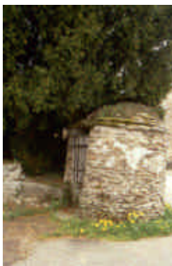
La Pierre de Neuvic, Neuvic-Entier

Atelier ou petite demeure. Pierre d'évier, noir naturel des boiseries, appareillage en gros moellons têtus.