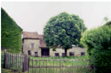
La Vialle, Saint-Méard

Grange-étable récente de type auvergnat, toute « moustachue » de vigne.