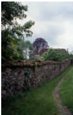
Le Bourg, Saint-Méard