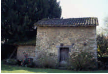
Petit Bueix, Châteauneuf-la-Forêt

Fournil avec étage. Toutes ces constructions qui ont été nécessaires à la vie paysanne, même en mauvais état, restent belles dans leur simplicité, sans froideur ni raideur.