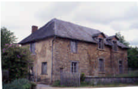
Le Bourg, Saint-Méard

Petite maison paysanne avec four à pain. Quelle était sa coiffure première ? Son faitage est en tuiles courbes rouges et sa cheminée a été refaite. On pourrait refaire la claie ou clède (portillon) et son muret d'enclos. Une bonne restauration passe inaperçue.