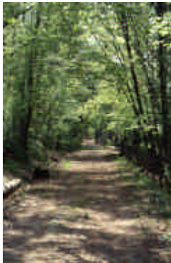
Le Cluzereau, Linards

Chemin de terre entre maisons et champs, longeant un enclos. Les arbres conservés dans la haie sont appelés « forêts de rives » par les forestiers.