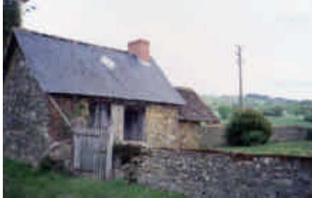
Les Rouchoux, La Croisille-sur-Briance

Petite maison paysanne avec four à pain. Quelle était sa coiffure première ? Son faitage est en tuiles courbes rouges et sa cheminée a été refaite. On pourrait refaire la claie ou clède (portillon) et son muret d'enclos. Une bonne restauration passe inaperçue.