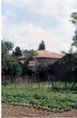
Le Bourg, Masléon