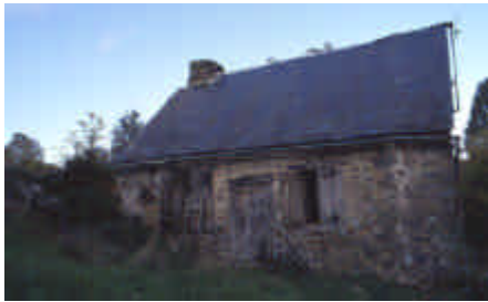
Le Bourg, Surdoux

Aujourd'hui la charrière est en herbe, aucune bête n'entre ni ne sort.