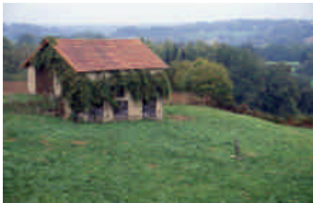
Le Bouquet, Roziers-Saint-Georges

Maison paysanne d'un petit propriétaire. La forte pente du toit et la présence de l'ardoise succédant au chaume rappelle un habitat familier de la montagne limousine.