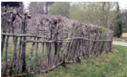
La Corive, Neuvic-Entier

Il s'agit ici d'un sautador de parcelle et non de cheminement.