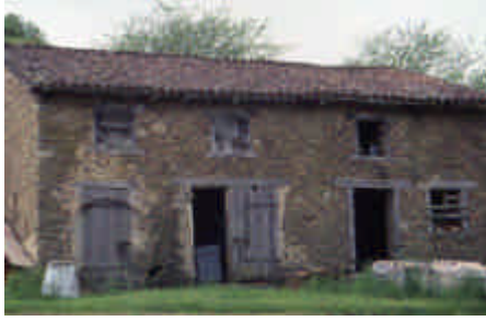
Sautour-le-Petit, Linards Etables et grenier

Maçonneries laissées crues. « Limousineries » de pierres tout-venant appareillées par lits.