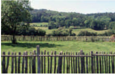
Le Clos, Sussac

À chaque labour, des pierres ont été dérochées et transportées sur les limites parcellaires. En pays pierreux, les murets festonnent le maillage du bocage (après avoir pendant des siècles patiemment épierré pour libérer de la terre, aujourd'hui on creuse un trou au bulldozer et on les remet en terre).