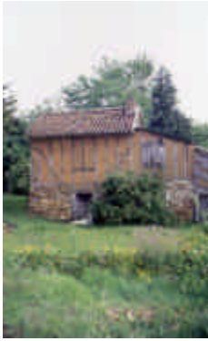
La Vialle, Saint-Méard