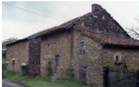
Sautour-le-Petit, Linards Grange-étable et habitation en longère

Maçonneries laissées crues. « Limousineries » de pierres tout-venant appareillées par lits.