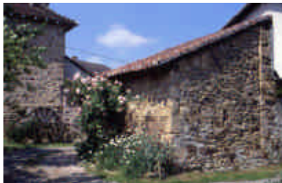
Le Bourg, Masléon

Maison d'habitation d'une propriété agricole importante de la fin du XIX e siècle. Un étage, couloir central. Toit à 4 eaux, à tuiles courbes. Chaînage appareillé en pierres de taille. Petites ouvertures carrées et oeil de boeuf central éclairant les combles. Bâtiment typique de la vallée de la Vienne (influence aquitaine).