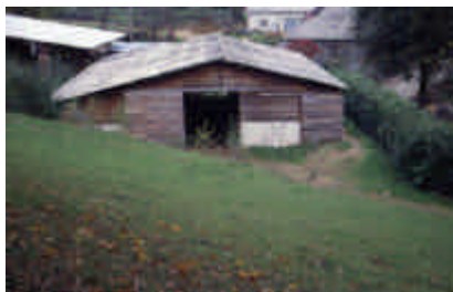
Grand Valeix, Roziers-Saint-Georges

Bâtiment solidement implanté sur un parcellaire contraignant.