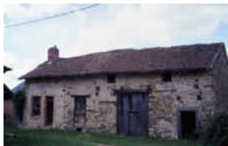
La Valade, Saint-Méard

Pas de règle absolue pour l'implantation du four à pain. Souvent, comme ici, il s'ouvre sur la cuisine.