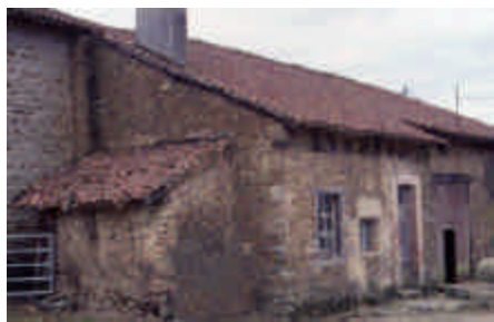
Le Mont Douhaud, Masléon

Charpentes de faibles pentes supportant voliges et tuiles courbes dans les communes orientées vers la vallée de la Vienne et le nord-est du canton.