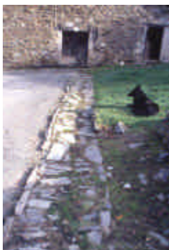
La Ribeyrie, Saint-Gilles-les-Forêts

Bon exemple pour nos abris de jardin. Fait main, sans raideur, obéissant au relief.