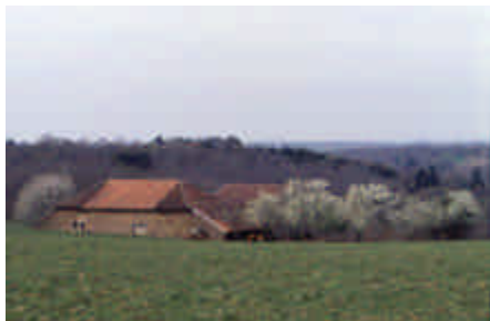
Le Puy, Neuvic-Entier

Toitures à fortes pentes. Tuiles plates à crochet. Le bâtiment adossé est peut-être un atelier de maréchal ferrant.