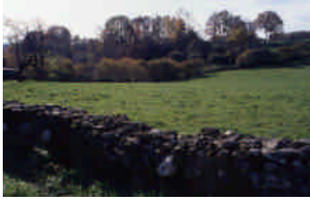
Le Bourg, Surdoux

À chaque labour, des pierres ont été dérochées et transportées sur les limites parcellaires. En pays pierreux, les murets festonnent le maillage du bocage (après avoir pendant des siècles patiemment épierré pour libérer de la terre, aujourd'hui on creuse un trou au bulldozer et on les remet en terre).