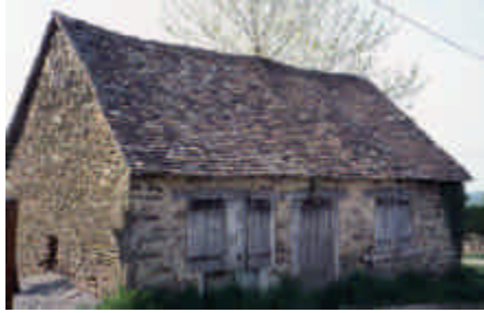
Le Barnagaud, La Croisille-sur-Briance

Il est bien facile de reconvertir les dépendances sans les défigurer, en petits abris divers.