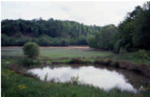
Le Grand Pré, Saint-Méard

Une réserve d'eau creusée en amont des terres et des prés, petit étang ou pêcherie, permet au printemps d'irriguer par rigoles le haut des prairies et, chaque jour, de faire boire les bêtes.