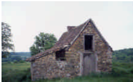
Bourdels le Haut, Saint-Méard

Une eau naturellement discrète révélée par le travail de l'homme. La planche (le pont) constituée de dalles de granite enjambe le petit ruisseau.