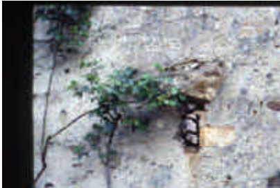
Puy Larousse, Linards

Sur ce mur, on devine le lattis de châtaignier, cloué sur les poteaux du pan de bois pour tenir le revêtement de mortier.