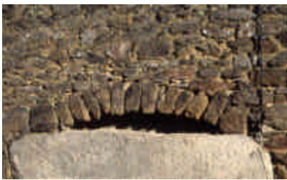
La Forêt Haute, Saint-Gilles-les-Forêts

Pierre posée en boutisse pour protéger la sortie du corbeau de bois qui soutien le manteau de l'âtre de la maisonnée. On ne se demande pas si « ça fait bien » ou « pas bien » ! On fait ce qui est utile.