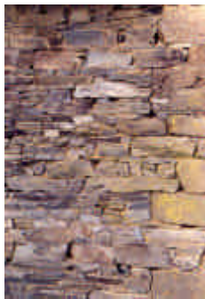
La Ribeyrie, Saint-Gilles-les-Forêts

Petite construction revêtue, pour la protéger de la pluie, d'un bardage de planchettes jointives avec couvre-joints.