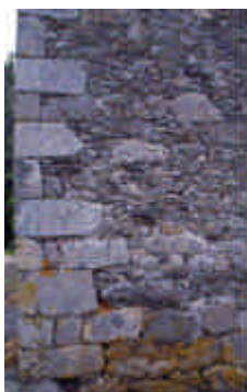
Le Bourg, Masléon

Le calage très compact de ce pied de maçonnerie, regarni au mortier de chaux, est tenu à l'angle par un chaînage en granite.