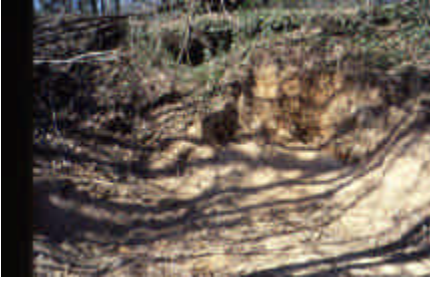
Puy de Vaux, Châteauneuf-la-Forêt

Les tuffières photographiées ici représentent la surface désagrégée de la roche mère, granite ou gneiss (appelée arène géologique).